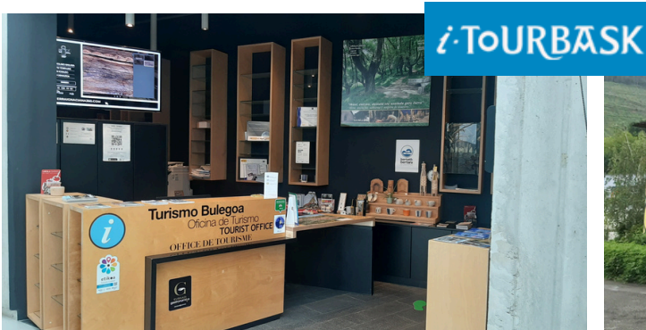
Oficina de turismo comarcal de Urola Garaia Gestionada por UGGASA

A lo largo del 2025 seguiremos con la gestión de la oficina de turismo comarcal situada en la Antigua, Zumarraga y con la colaboración de la oficina de turismo de Mirandaola situada en Legazpi, pertenecientes ambas a la red de oficinas Itourbask.