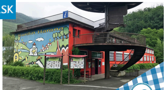
Oficina de turismo de Mirandaola en Legazpi Gestionada por Lenbur Fundazioa